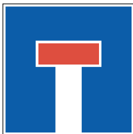
Sackgasse für alle Verkehrsteilnehmenden