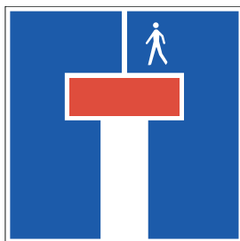
Sackgasse für den fahrenden Verkehr