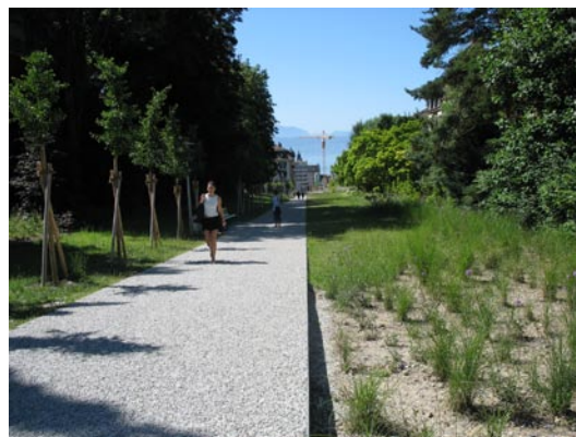
Illustration de couverture: un espace public de qualité, ville de Neuchâtel. Photo: Thomas Schweizer

Profiter des grands travaux d'infrastructures pour repenser l'espace public: la coulée verte sur l'ancien tracé de la Ficelle, ville de Lausanne. Photo: Thomas Schweizer