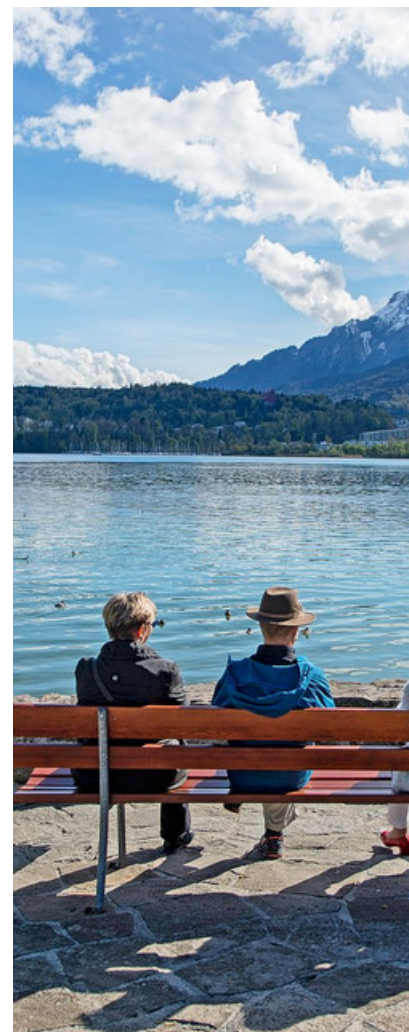
Die Schweizer Bankvielfalt ist gross. Bänke, futuristische Bänke – an Seestranden, in Strassen, in Stadtzentren.

Wurden in den letzten Jahren gerade um Bahnhöfe herum Sitzgelegenheiten abmontiert oder unbequem gestaltet, um langes Verweilen zu verhindern, sind einzelne Schweizer Städte heute gar als Trendsetterinnen unterwegs und möblieren den öffentlichen Raum stellenweise wie ein Wohnzimmer. Dafür werden Strassenstücke gesperrt oder Parkplätze umfunktioniert. In Bern beispielsweise wird seit 2018 ein Teil des Waisenhausplatzes im Sommer mit einer Bühne, Sitzmobiliar, Spielmöglichkeiten und grünen Inseln ausgestattet. Die zeitliche Befristung habe den Vorteil, dass kein langwieriges Bewilligungsprozedere nötig sei und ein Projekt schnell umgesetzt werden könne, sagt Claudia Luder, Projektleiterin Gestaltung und Nutzung des Berner Tiefbauamts. Sie leitet auch das