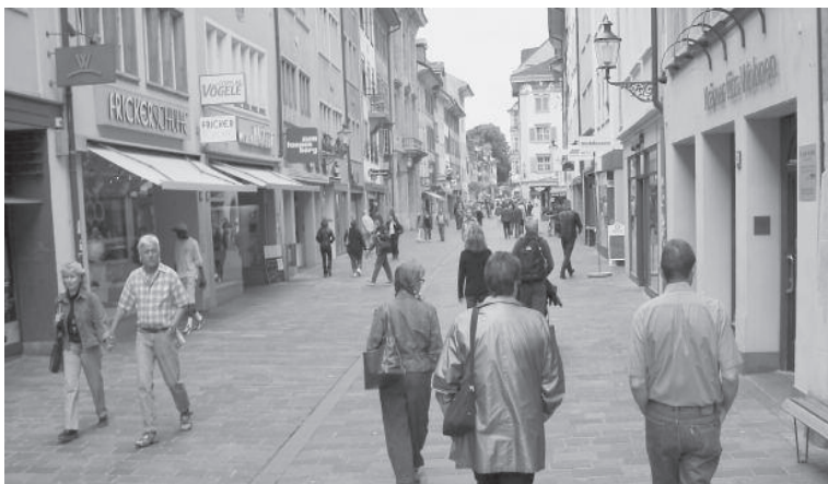
Marktgasse in Winterthur