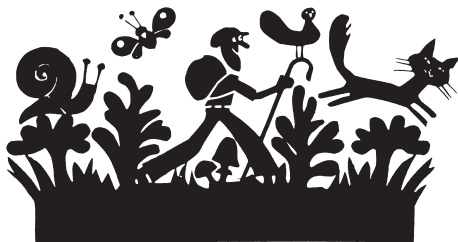
Erstes Logo von ARF

Am 18. Februar 1979 stimmte das Schweizervolk einem Verfassungsartikel für Fuss- und Wanderwege mit überwältigendem Mehr zu, mit 78% Ja gegen 22% Nein. Der Verfassungsartikel musste indessen hart errungen werden. Zwischen dem Beginn und dem Abstimmungsergebnis lag ein weiter und steiniger Weg mit zahlreichen und oft schier unüberwindbar scheinenden Hindernissen und auch mit Rückschlägen.