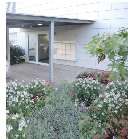
Les boîtes aux lettres sont idéalement situées à l'entrée et à l'abri.

Enfin, un écran situé proche de l'entrée et affichant les heures des prochains départs des bus, trams ou trains desservant les arrêts alentours est toujours très apprécié des usagers des transports publics. Des vitrines peuvent venir compléter ce dispositif en accueillant d'autres informations importantes.